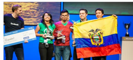
Equipo PUCE Quito: premio categoría Creativity Award en Facebook ( Rusia)